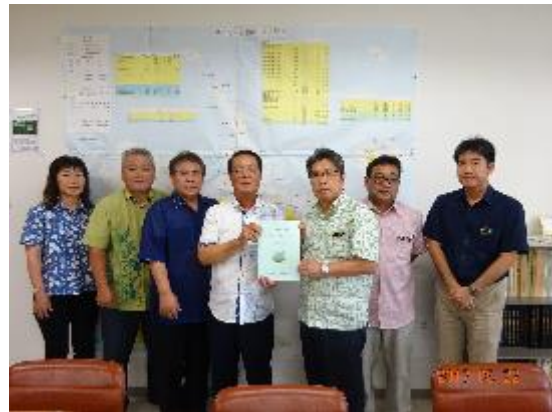
・宮古農林水産振興センター (H29.5.22)