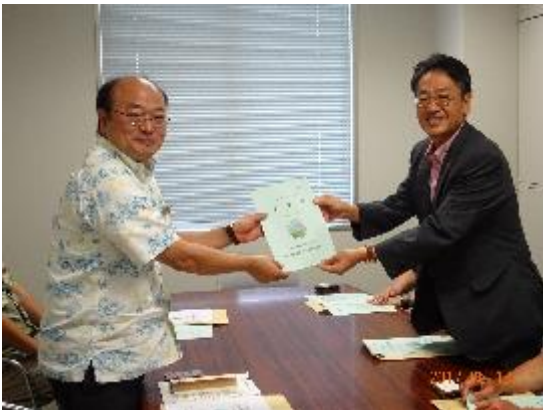
・沖縄総合事務局農林水産部 (H29. 5. 18)