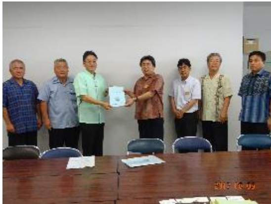
・中部農林土木事務所 (H29.6.5)