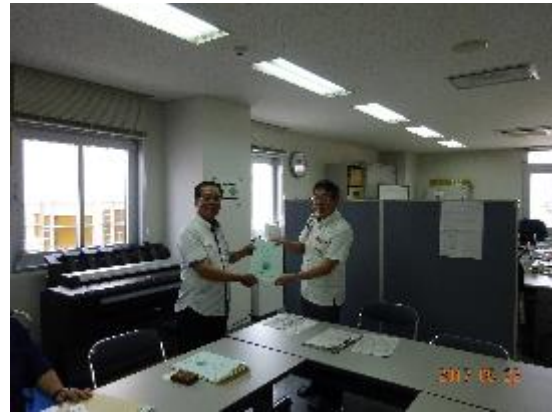
・土地改良総合事務所宮古支所 (H29. 5. 22)