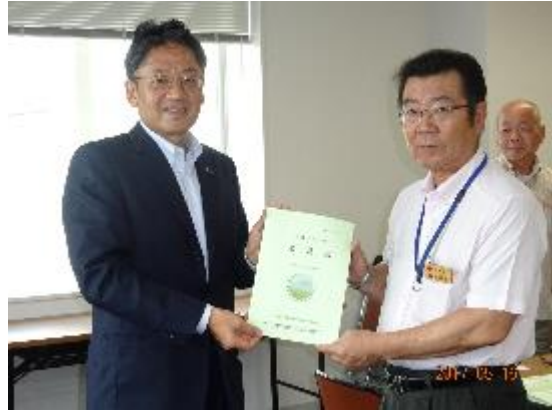
・南部農林土木事務所 (H29.5.16)