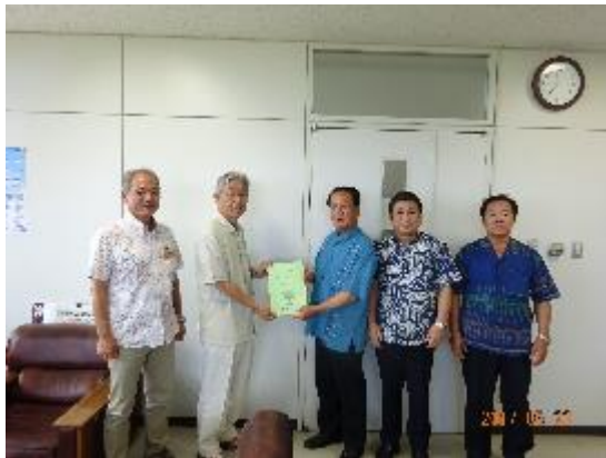
・八重山農林水産振興センター (H29.5.23)