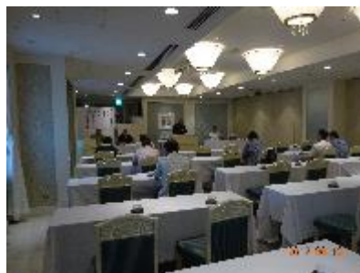
賛助会員定時総会