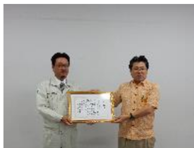
(株)大城組 優良技術者