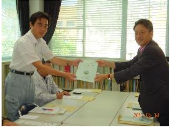
・土地改良総合事務所 (H29.5.18)