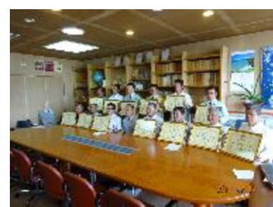
農林水産部長と表彰者