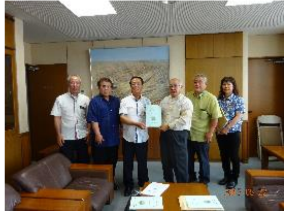
・宮古島市 (H29. 5. 22)