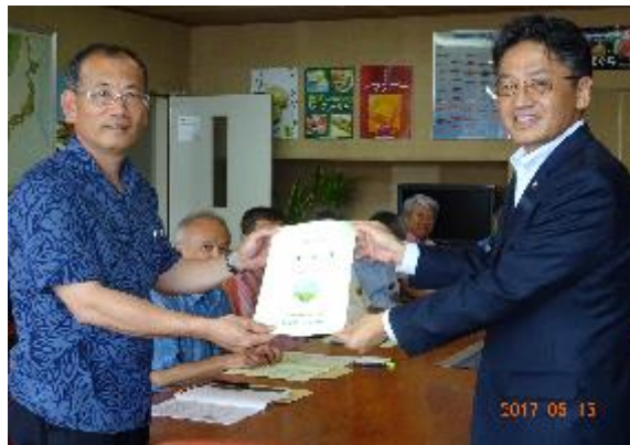
・沖縄県農林水産部 (H29. 5. 16)