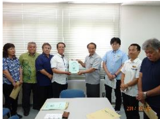
・宮古伊良部農業水利事業所 (H29.5.22)