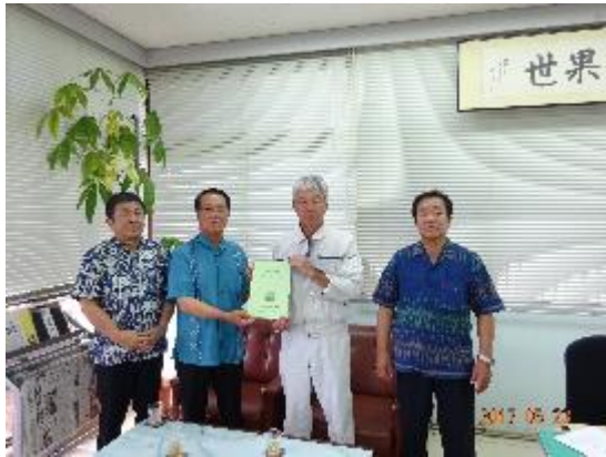
・石垣島土地改良区 (H29. 5. 23)