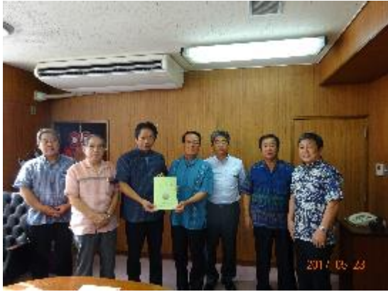
・石垣市 (H29. 5. 23)