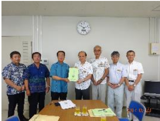
・石垣島農業水利事業所 (H29.5.23)