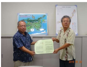
石垣島農業水利事業所 ↑ ↓