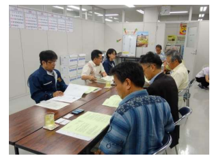
北部農林水産振興センター