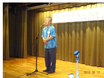
懇親会(手登根会長挨拶)