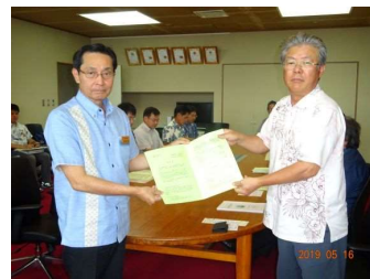
沖縄県農林水産部