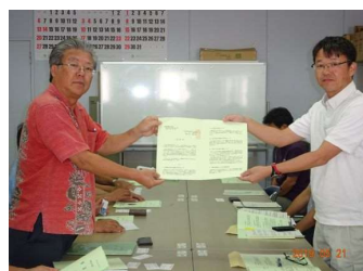
↑ ↓ 宮古伊良部農業水利事業所及び土地改良総合事務所宮古支所 ↑