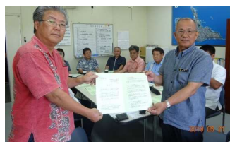
宮古島市農林水産部