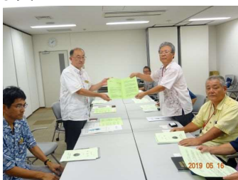
沖縄総合事務局農林水産部