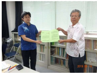
土地改良総合事務所