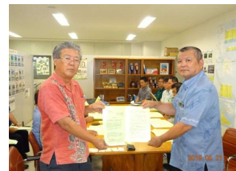
宮古農林水産振興センター ↑ ↓