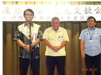
賛助会玉城会長及び城間・高嶺副会長