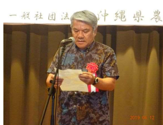
沖縄県 島袋農漁村基盤整備統括監