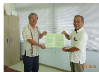
石垣島土地改良区 ↑