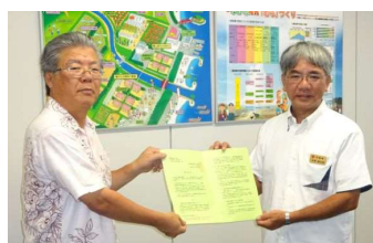
←沖縄県南部農林土木事務所→