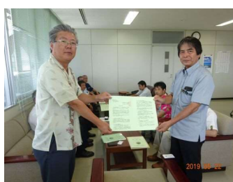
八重山農林水産振興センター ↑ ↓