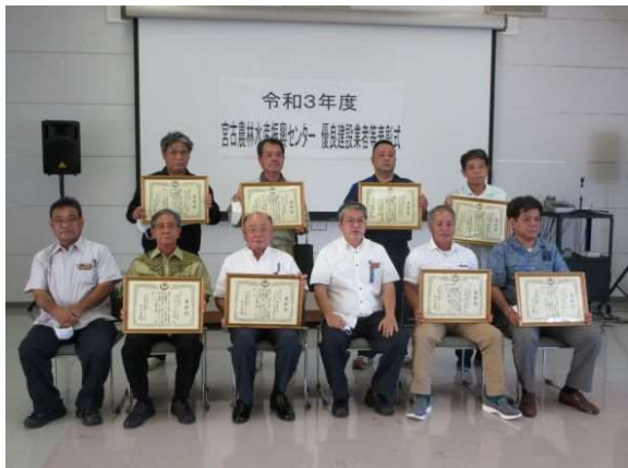
受賞者集合(前列左から4番目は県宮古農林水産振興センター砂川所長、1番目は平良農林水産整備課長)