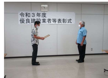
國光建設 新里建支氏