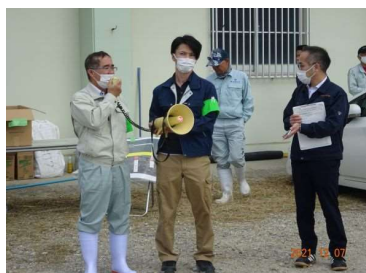
中部農林土木事務所 宮城所長