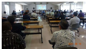
↑ 研修状況 ↓

※ 上記③・⑥・⑦については、当会事務局長により代理講演(コロナウイルスの感染状況を考慮)