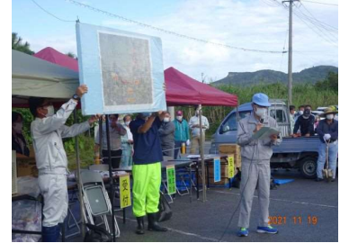
<開会式> (左から) 県南部農林土木事務所新垣所長、南城市瑞慶覧市長、作業の説明