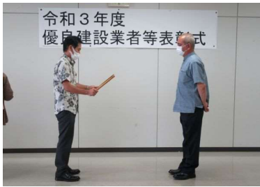
國光建設 新里一支氏