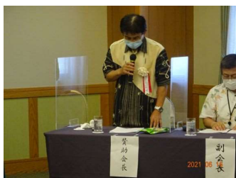
玉城賛助会長挨拶