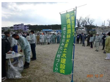
↑ 受付 ↓ 清掃区域