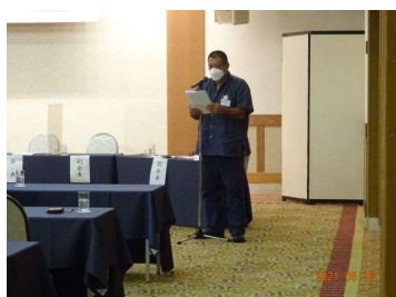
監査報告:内間代表監事