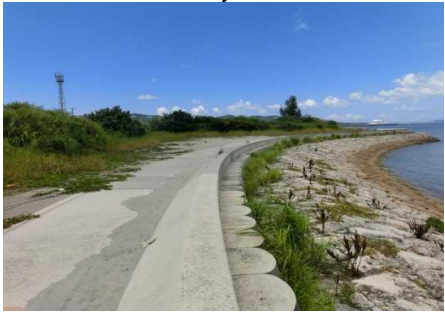
北地区全景と駐車場2