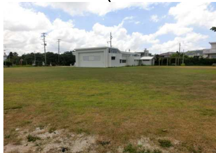
集合場所と駐車場1