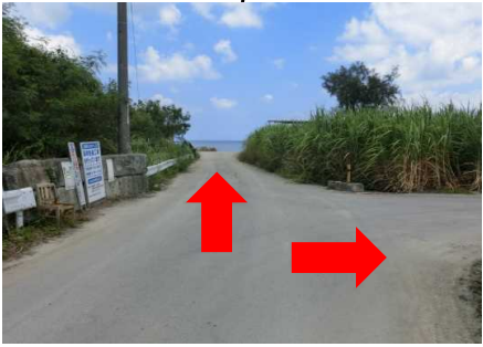
↑:北地区へ →:南地区へ