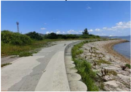
北地区全景と駐車場2