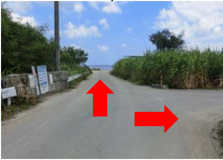
↑:北地区へ →:南地区へ