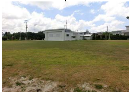
集合場所と駐車場1