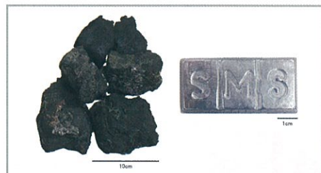
海底熱水鉱床の鉱石(左)と製錬所で製造した亜鉛地金(右)

海洋資源の調査・研究は実証実験の段階に入り、沖縄周辺深海底の海底熱水鉱床鉱石から亜鉛地金を製造することに成功しています。海底鉱物資源の開発など、海を舞台にした新しい産業への取り組みは、沖縄県内でも進んでいます。最新の状況や今後の課題を皆様にご報告します。