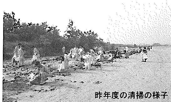
昨年度の清掃の様子